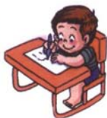
已開始較常用特定一邊的手