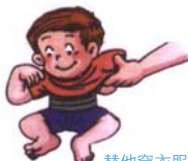
替他穿衣服會自動的伸出胳膊或腿