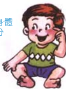
能指出身體的一部分