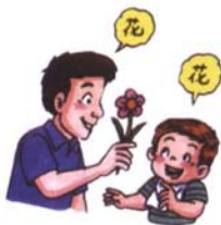
會跟著或主動說出一個一個單字