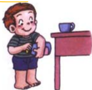
會把瓶子的蓋子打開