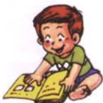
會一頁一頁的翻圖畫書