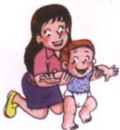
雙手拉著會移幾步