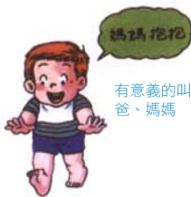
有意義的叫爸爸、媽媽