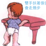
雙手扶著傢俱 會走幾步