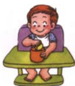
會把一些小東西放入 杯子