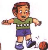
會踢球（一腳站立另一腳踢）