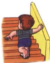
牽著他或扶著欄杆可以走上樓梯