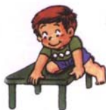
會自己從椅子爬下