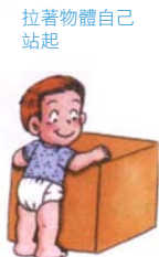
拉著物體自己 站起