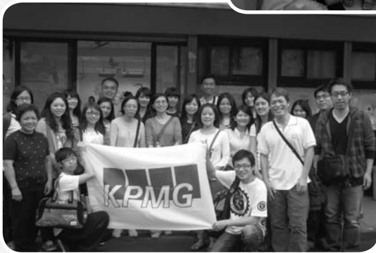
安侯建業會計師事務所志工活動