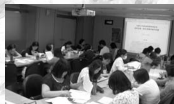
個管員成長團體-小組討論