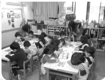
融合教育—創意蘋果幼兒園