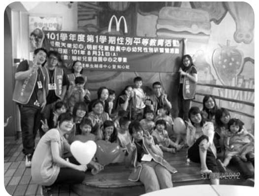
景文科技大學志工活動—麥當勞