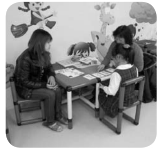
鶯歌定點療育服務