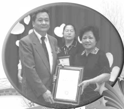
明新兒童發展中心