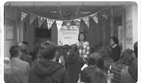
中心家長會，透過師生之間彼此分享討論，互相鼓勵學習，獲得更多實際支持