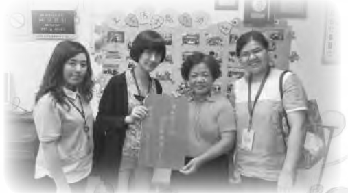
中和區公所訪視關懷