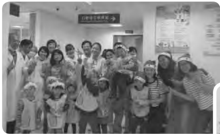
中心孩子們在今年第一次嘗試聖誕報佳音活動，來到雙和醫院、耕莘醫院..等社區中，讓所有的參與民眾及鄰居朋友們，都感受到滿滿的幸福與溫暖