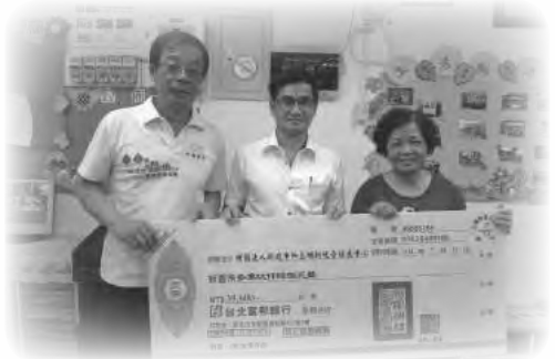
金樹建設蒞臨關懷