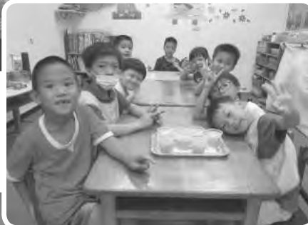
台新銀行大家一起做朋友社區融合活動，中小朋友和附近幼兒園的孩子一同合作遊戲、互相幫忙學習，希望讓彼此都能有成長進步的機會