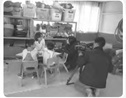
感謝東森新聞來訪拍攝中心小朋友平日的學習狀況，讓更多社會大眾認識早療的重要性與意義