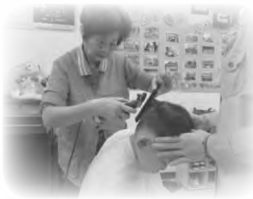
中和志願團義剪服務