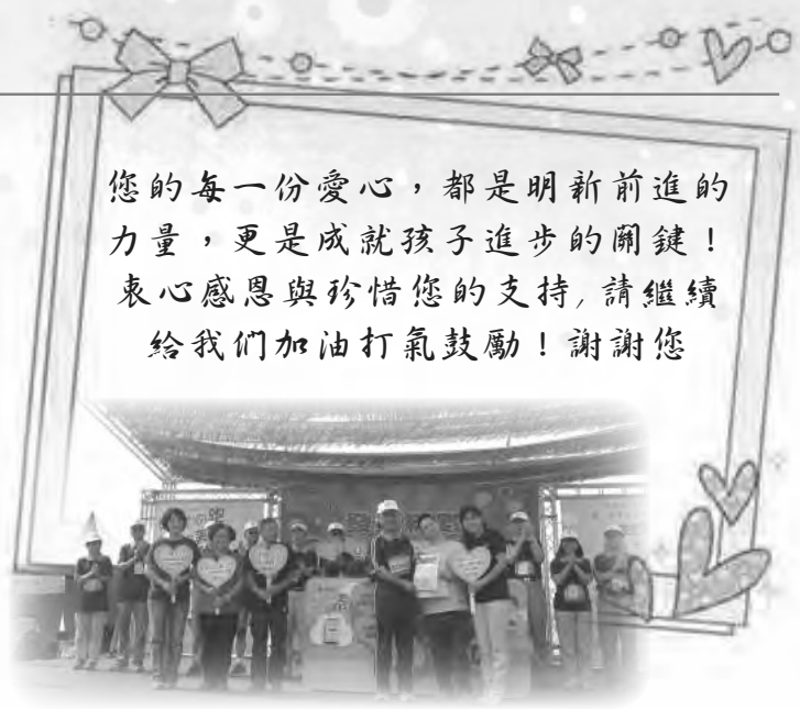
財政部統一發票盃路跑捐贈活動

您的每一份愛心，都是明新前進的力量，更是成就孩子進步的關鍵！衷心感恩與珍惜您的支持，請繼續給我們加油打氣鼓勵！謝謝您