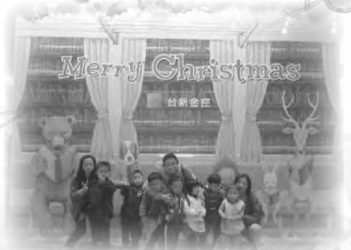
台新銀行聖誕園遊會