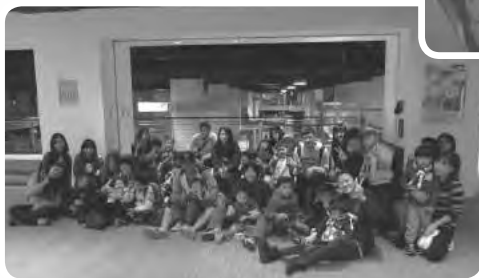
感謝東吳大學志工日活動，同學們於美好的假日，帶小朋友前往國立科教館進行一日遊