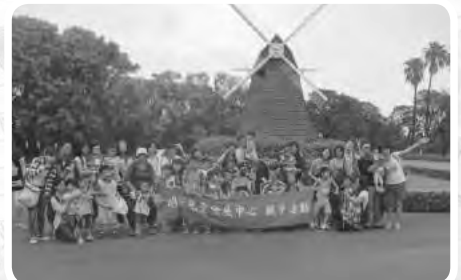
中心親子活動來到埔心牧場，小朋友和家長、老師們都一起度過了美好的一天