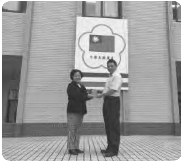
感謝智光商工捐贈「年終歲末二手物品愛心義賣」所得經費，感謝全體師生對中心的支持