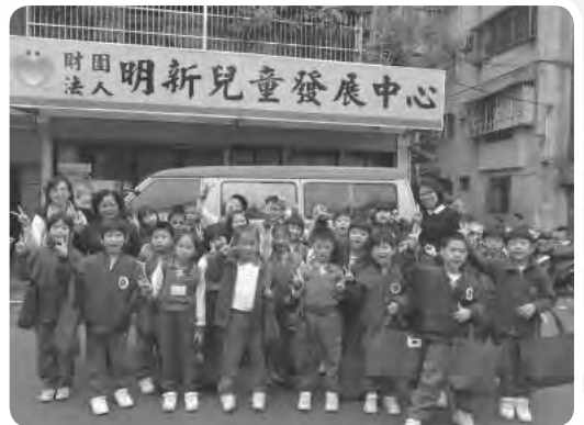
每年都固定來訪的復興小學，熱情有禮的小學生，透過難得的生命教育志工活動機會，有不同的學習經驗，並和中心的小朋友們彼此都留下美好的回憶