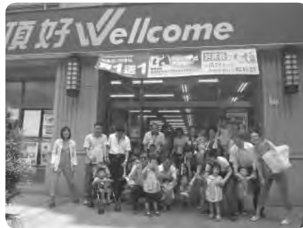
感謝每年KPMG志工日活動，都來到中心帶小朋友們外出購物遊玩