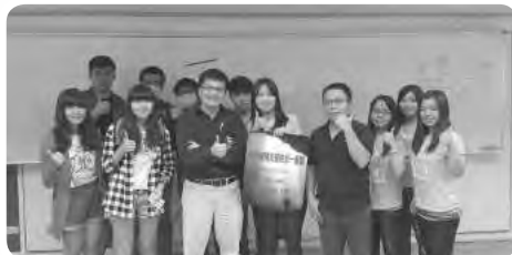
中心社工團隊很榮幸受邀來到了中央大學做早療宣導，讓我們的服务理念能夠推廣給更多社會中不同的族群認識