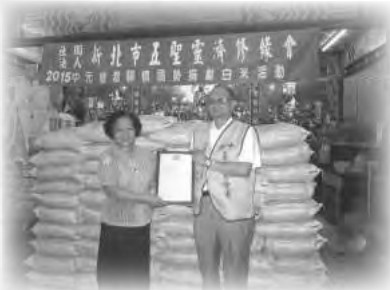
五聖靈濟會愛心捐贈白米

您的每一份愛心，都是明新前進的力量，更是成就孩子進步的關鍵！衷心感恩與珍惜您的支持，請繼續給我們加油打氣鼓勵！謝謝您